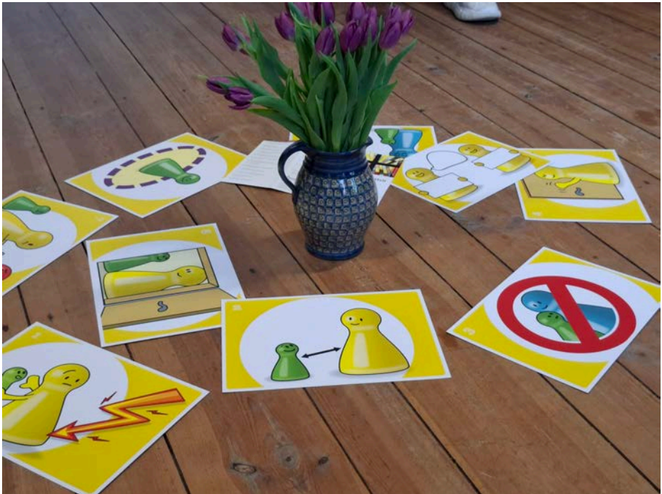
Text und Foto: Katrin Seidel

Hier trafen sich ehrenamtlich Tätige aus dem Kirchenkreis und konnten im Austausch dieses sensible Thema besprechen. Um unsere Gemeinschaft zu stärken und vor Machtmissbrauch in vielfältiger Hinsicht zu schützen, braucht es mehr Hinschauen, Zuhören und aktives Handeln.